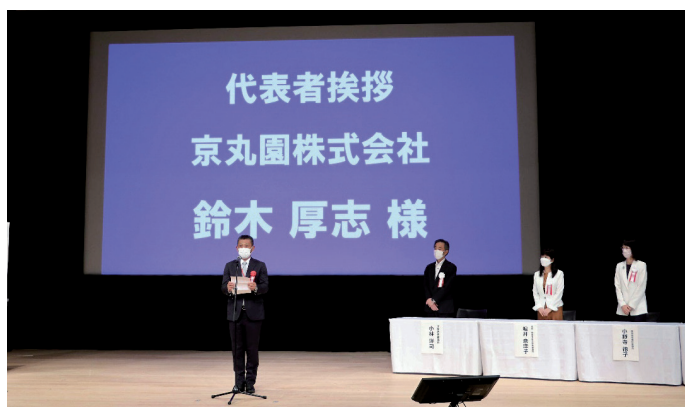
被表彰者代表、京丸園株式会社からの謝辞の様子